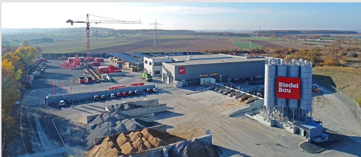
Riedel Bau Logistikzentrum mit Transportbetonwerk in Berggrheinfeld, Schweinfurter Straße 137.