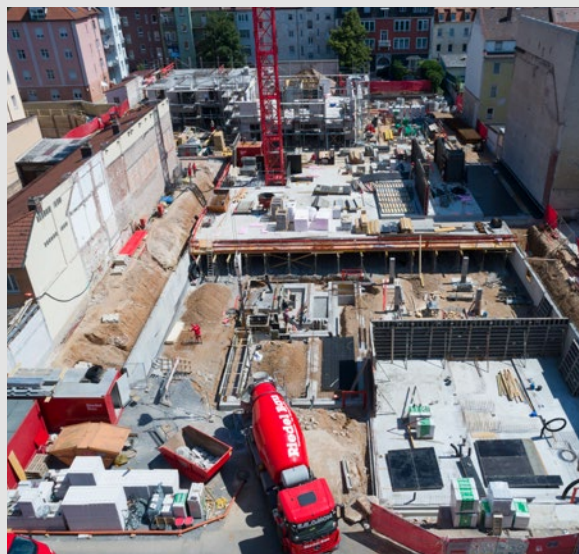
Betonlieferung an der Baustelle der Wohnanlage „Riedel Höhe“ in Schweinfurt.

Veränderungen der gelieferten Baustoffe sind unzulässig, insbesondere durch Zugabe von Wasser. Unsere Fahrer sind angewiesen kein zusätzliches Wasser hinzuzugeben. Wird eine Wasserzugabe gefordert, geschieht dies auf Verantwortung des Abnehmers. In diesen Fällen erlischt für uns die Gewährleistung der Qualität, Festigkeit und eventuell besonderer Eigenschaften des gelieferten Betons.